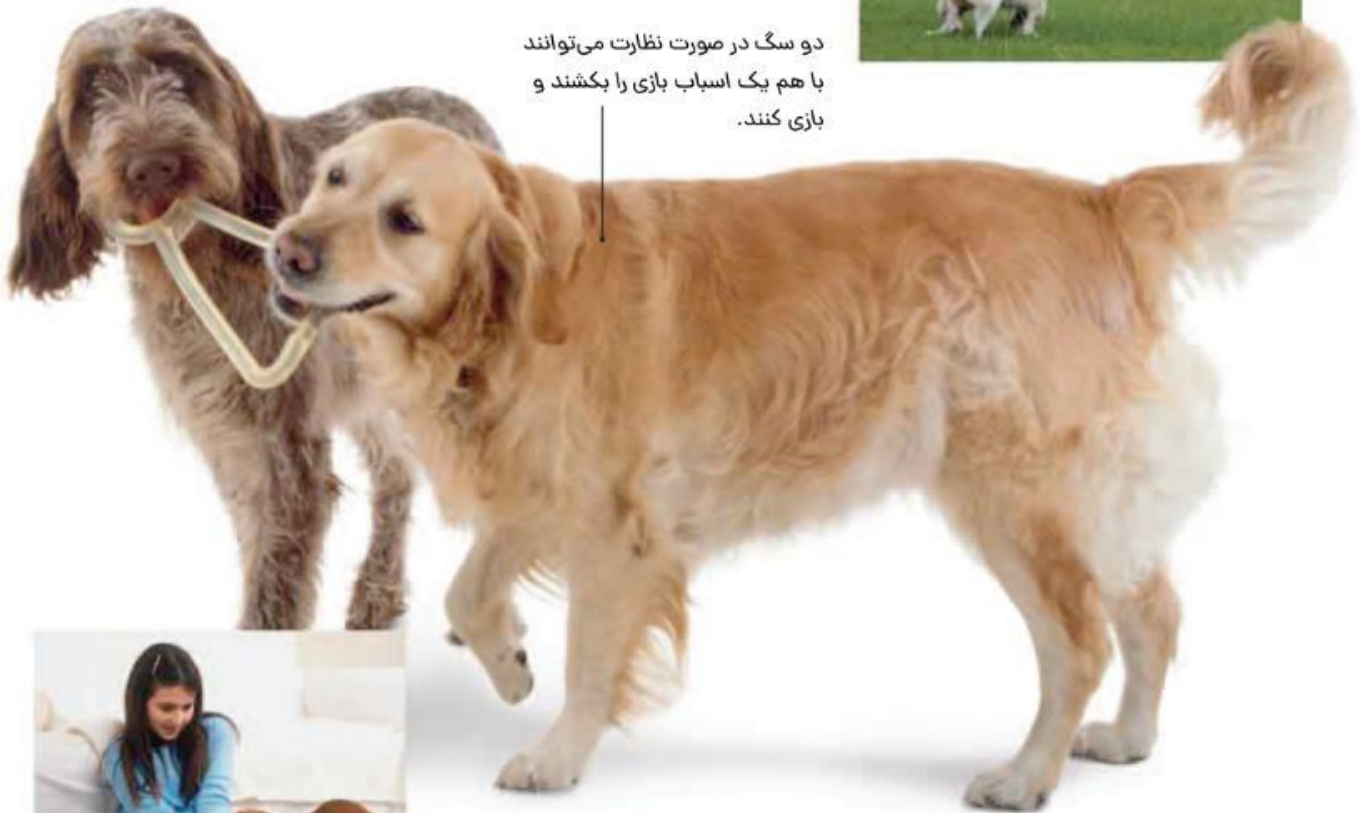
بازی کشیدن اسباب بازی

دو سگ در صورت نظارت می‌توانند با هم یک اسباب بازی را بکشند و بازی کنند.