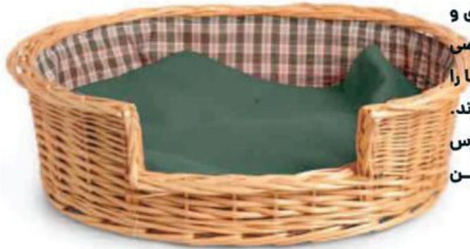
سبد حصیری سگ