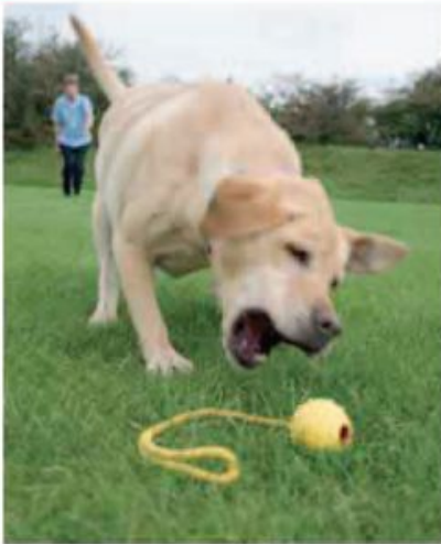
بازی رفتن و آوردن توپ

این بازی را می‌توان با خرید توپ‌های سازگار با دسته‌های طناب یا چوب مخصوص پرتاب، برای بازوهای شما آسان‌تر کرد. سگ شما با این فعالیت تحرک بدنی زیادی خواهد داشت.