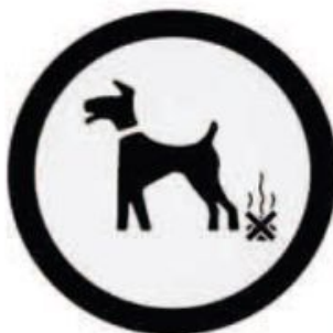
مراقب مناطق "مدفوع ممنوع" باشید

عمل ساده پیاده روی نیاز سگ شما به دفع مدفوع را تحریک می کند. این کار احتمالاً در ابتدای پیاده روی اتفاق می افتد، بنابراین سگ خود را تا زمانی که کار خود را انجام می دهد، با بند قلاده نگه دارید. هر زمان که سگ خود را به پیاده روی می برید کیسه های مدفوع زیست تخریب پذیر نیز با خود ببرید. رول های کیسه را می توان در کیف های مخصوص کیسه مدفوع قرار داد که ممکن است به کمربند یا دسته بند قلاده متصل شوند. در برخی از مکان ها، صاحبان از نظر قانونی ملزم به تمیز کردن مدفوع سگ های خود هستند.