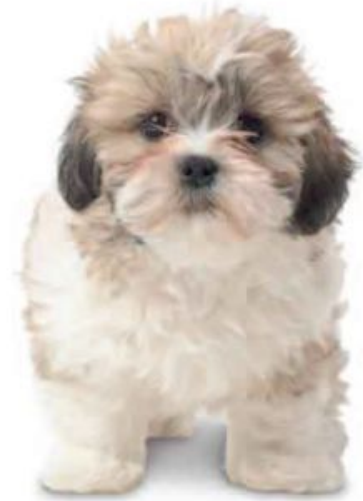
اکنون کوچک اند، اما در آینده چطور؟

همه عاشق یک توله سگ هستند! اما مگر اینکه آن توپ پشمالو با صدای جیغ "چی واوا" یا نژاد کوچک دیگری باشد وگرنه برای مدت طولانی در این اندازه باقی نمی ماند. دیدن والدین توله سگ شما نشان می دهد که چقدر بزرگ می شود، به خصوص اگر با یک سگ اصیل باشد. اگر یک نژاد مخلوط است، خود را برای هر چیزی آماده باشید. توله سگ ها مخصوصاً برای بچه های خیلی کوچک خوب هستند، زیرا می توانند با هم بزرگ شوند و یک پیوند مادام العمر ایجاد کنند.