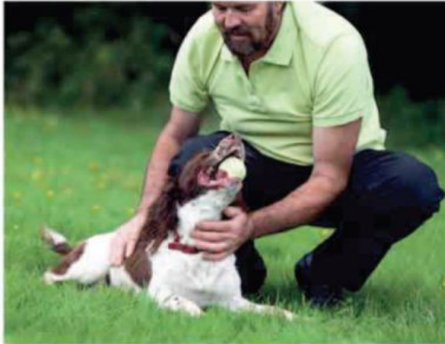
بازی و تفریح برای سگ‌ها مهم است.