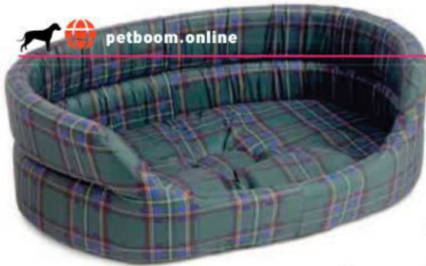
تخت سگ پارچه‌ای با بالشتک‌های نرم درونی