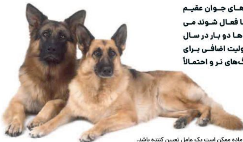
نسبت به اندازه آگاه باشید

هنگام انتخاب سگ بر اساس جنسیت باید به نکاتی توجه داشت. نرهای جوان عقیم نشده زمانی که هورمون های جنسی آن ها فعال شوند می توانند مشکل ساز شوند، در حالی که ماده ها دو بار در سال فصل می شوند، که به معنای کار و مسئولیت اضافی برای صاحبش و همچنین مقابله با پیشروی سگ های نر و احتمالاً تولد توله ها است.