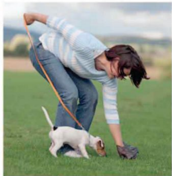
ابتدا مدفوع و سپس بازی

هنگامی که مدفوع سگ خود را تمیز کردید، او را از بند خارج کنید. به زودی متوجه می شود که زمان بازی بعد از زمان دستشویی می آید.