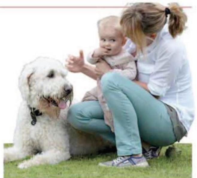
سگ‌ها و کودکان می‌توانند بهترین دوستان یکدیگر شوند.

آگاه باشید که هزینه‌ها از جمله هزینه غذا، واکسیناسیون و سایر هزینه‌های دامپزشکی، بیمه، پانسسیون حیوانات در هنگام سفر، و... به میزان قابل توجهی افزایش خواهند یافت. همچنین به شیوهی زندگی‌تان نیز توجه داشته باشید: آیا زمان و فضای کافی برای ایجاد محیطی بدون استرس برای سگ در طول تمام عمرش را دارید؟ آیا می‌توانید با یک سگ و کودکان کنار بیایید؟ آیا آماده‌اید که فضولات سگتان در مکان‌های عمومی را تمیز کنید؟