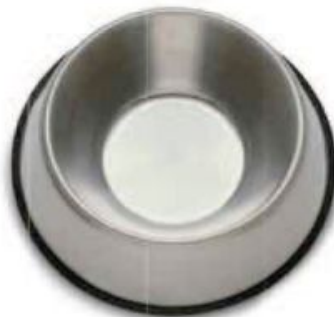
کاسه استیل ضد زنگ

هر سگ در خانه شما باید ظرف آب و غذای مخصوص به خود را داشته باشد. کاسه‌های استیل ضد زنگ بادوام‌ترین آنها هستند و معمولاً با یک حلقه لاستیکی متصل به لب پایینی عرضه می‌شوند تا از سر خوردن آنها روی زمین در هنگام غذا خوردن جلوگیری کند. کاسه‌های سرامیکی سنگین‌تر هستند و احتمال لغزش کمتری دارند، اما در صورت افتادن بیشتر مستعد شکستگی می‌باشند.