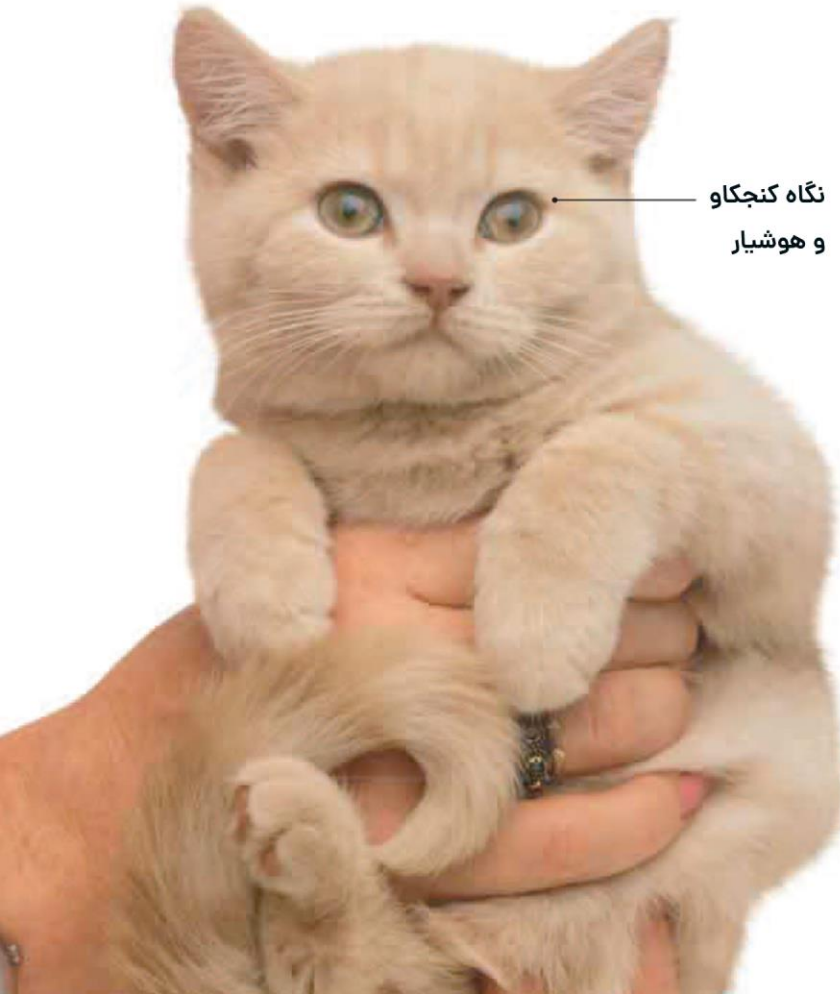
نگاه کنجکاو و هوشیار

بعد از اینکه گربه‌تان را بلند کردید، آن را به آرامی مقابل سینه خود قرار دهید و تا جایی که می‌توانید او را به بدن خود نزدیک کنید. این کار باعث میشود احساس امنیت کند. اگر در بغل شما شروع به دست و پا زدن کرد او را به آرامی روی زمین بگذارید. تا زمانی که او آرام است می‌توانید در بغلتان نگهش دارید.