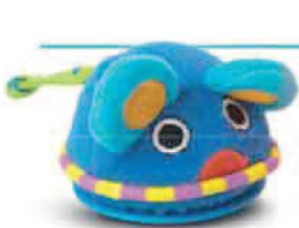
اسباب بازی کرکی