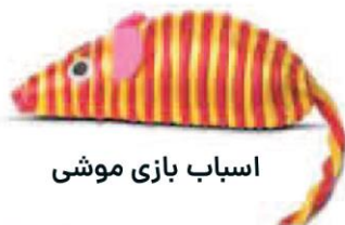
اسباب بازی موشی