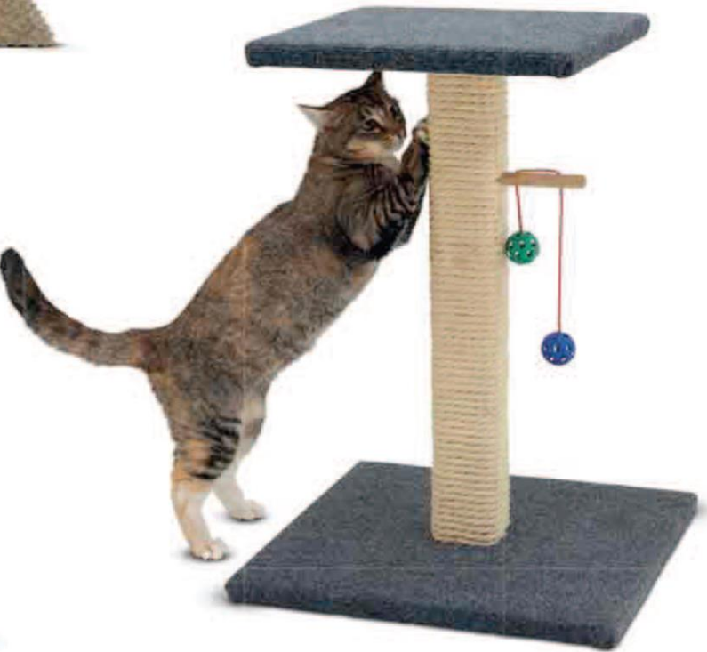
اسکرچر اسباب بازی دار